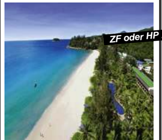
Kata Noi Beach - Phuket

Verl.-Nacht ZF +Fr. 60.- p.P./Tag Preisbasis: Superior Room Halbpension Fr. 25.- p.P./Tag