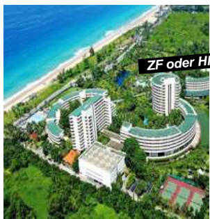
Karon Beach - Phuket

Verl.-Nacht ZF +Fr. 50.- p.P./Tag Preisbasis: Deluxe Garden-View Sea-View Fr. 10.- p.P./Tag Halbpension Fr. 30.- p.P./Tag