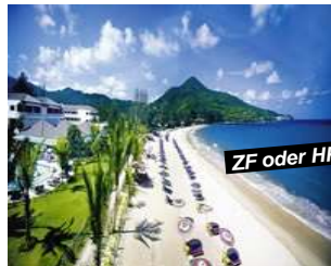
Kamala Beach - Phuket

Verl.-Nacht ZF +Fr. 30.- p.P./Tag Preisbasis: Deluxe Ground Terrace Halbpension +Fr. 15.- p.P./Tag