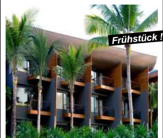
Mai Khao Beach - Phuket

Verl.-Nacht ZF +Fr. 70.- p.P./Tag Preisbasis: Deluxe Room