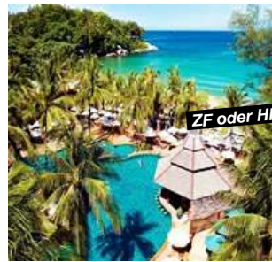
Kata Beach - Phuket

Verl.-Nacht ZF +Fr. 45.- p.P./Tag Preisbasis: Superior Room Halbpension +Fr. 20.- p.P./Tag