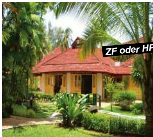
Phuket - Bang Tao Beach

Verl.-Nacht ZF +Fr. 35.- p.P./Tag Preisbasis: Superior Room Halbpension +Fr. 15.- p.P./Tag