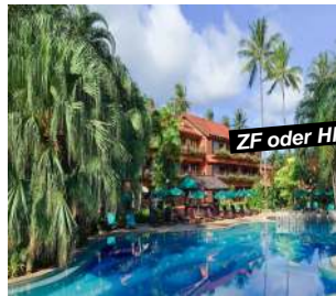
Phuket - Patong Beach

Verl.-Nacht ZF +Fr. 40.- p.P./Tag Preisbasis: Superior ROH Room HP nur vor Ort buchbar