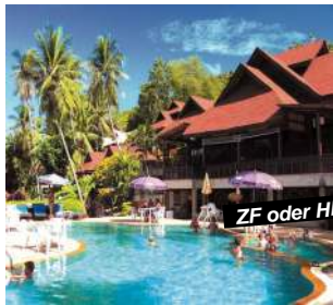
Chaweng / Lamai

An einer kleinen Bucht mit kleinem Strand zwischen Chaweng und Lamai. Das Hotel ist in Hanglage gebaut, mit herrlicher Sicht auf die Chaweng-Bucht. Aufgrund der Hanglage ist die Bademöglichkeit eingeschränkt, Badeschuhe werden empfohlen!