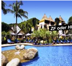
Karon Beach - Phuket

Verl.-Nacht ZF +Fr. 65.- p.P./Tag Preisbasis: Deluxe Garden View Halbpension Fr. 40.- p.P./Tag